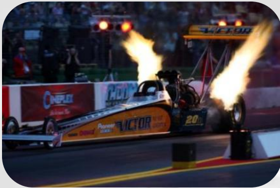
☞ Top-Fuel Night-Runs