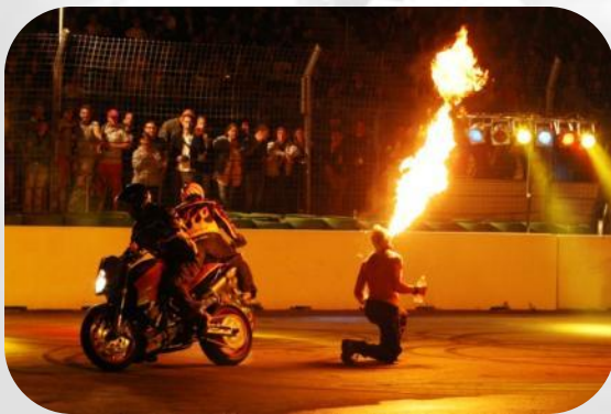
☞ Feuerwerk & Pyro-Show