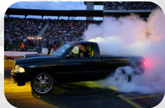
☞ Burn-Out Contest