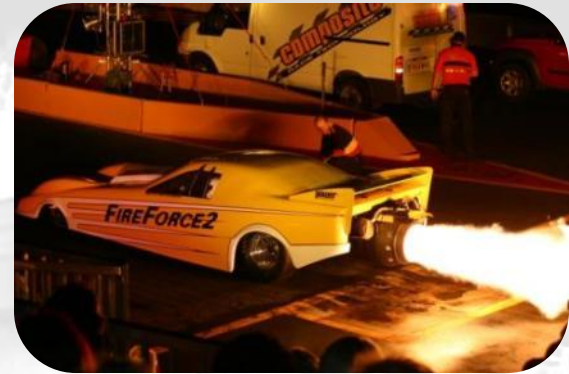
☞ Jet-Dragster Shootout