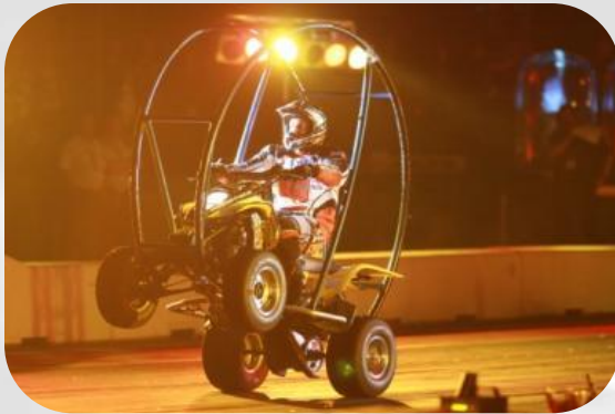
☞ Akrobatische Stunts